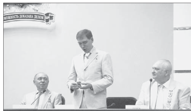
Герой России, космонавт Сергей Волков подарил «космический уголь» губернатору Донецкой области