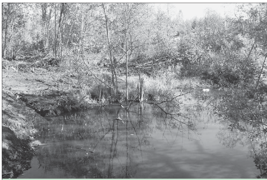
На месте будущего Экологического центра в Шлиссельбурге было заброшенное место и болото