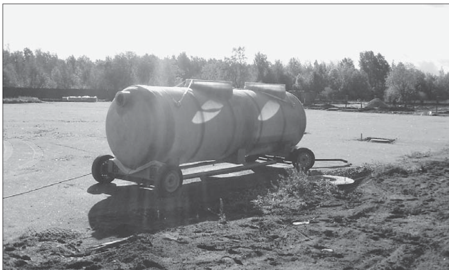
В Экологическом центре будут проектировать и производить очистные сооружения