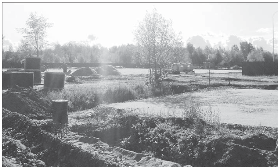
Работы по строительству Экоцентра ведутся грамотно и в срок