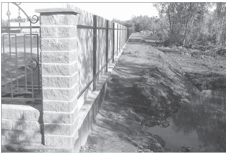
Работы по благоустройству территории для возведения Экологического центра