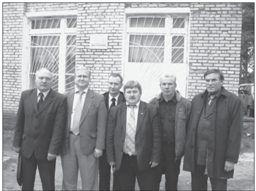
Сайт «Компания Усть-Луга» www.ust-luga.ru