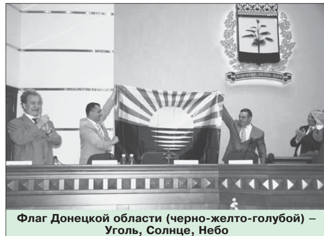
Флаг Донецкой области (черно-желто-голубой) – Уголь, Солнце, Небо