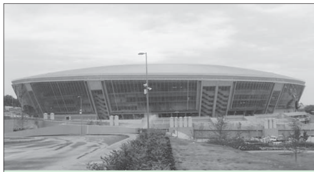
В Донецке открыт новый стадион «Донбасс-Арена»

вским регионом сложились самые дружеские отношения. А флаг Донецкой области собираюсь лично вручить губернатору Ленинградской области В.П.Сердюкову, тем более Валерий Павлович в прошлом был шахтёром».